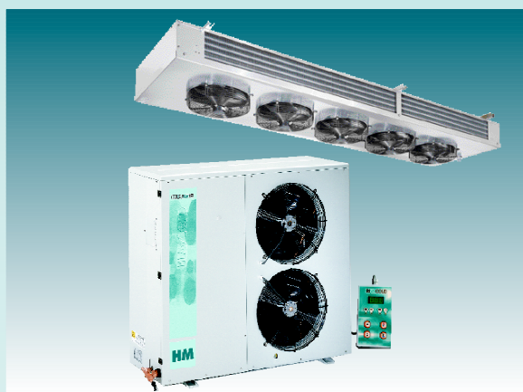
Serie Split - con areoevaporatore doppio flusso Split range - with dual air flow ceiling unit coolers Gama Split - con evaporador de doble flujo